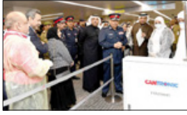
السيد وزير التعليم الدكتور

اللجنة الوطنية، تعقد اجتماعاً طارئاً لانتخاب «كورونا» تفعيل المركز الوطني لواجهة الكوارث ورفع جاهزية الإسعاف الوطني